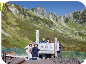
登山がきっかけで、こんな時もあるよ。