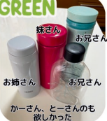
かーさん、とーさんのも欲しかった

●右グリーン&クリア…長男(大学生) クリアタイプは大学で支給され、次女同様に学内のウォーターサーバーで好きな時に給水しています。無印良品のもので、その名も「自分で詰める水のボトル」マイボトルを持ち歩くことに抵抗がなく、当たり前世代。親世代も見習いたいです。(河合)