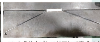
④ もう片方プレス加工して完成です。