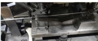
② 金型にセットしプレスします。