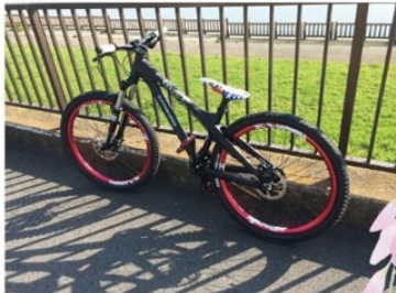
(※写真は初めて買ったMTB (レース用))

当時TBSの緑山スタジオ敷地内にコースがあり、最初はレースの見学だったはずが、いつの間にかレースに出ているという(+、+) 女性の競技人数は少なく、ちょっと頑張れば表彰台にも立てます。(2位になったことがある!) ただ転倒すると結構な確率で骨折する人も多い危ない競技です。。。 (折谷)