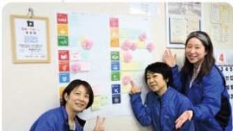
掲げたSDGs目標を実行、達成出来たらお花をつけて見える化しています。By ecoritani委員

以前からプラスチックハンガーの回収・再材料化は活発に行っていますが、それに留まらず様々な角度からSDGsを社内で促進し続けます。