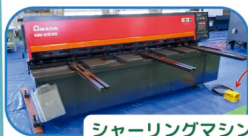
シャーリングマシン

金属板を素早く大量に切断できる電動工具です！ 機械の中に上下に刃があり、ハサミで紙を切るのと同じように挟んで切断します！(中矢)