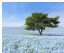
国営ひたち海浜公園

私はこの機会に家の大掃除を済ませ、読書とランニングに励む日々。自転車で転んだ以外は、なかなか有意義なゴールデンウィークでした(^v^)k 皆さまはゴールデンタイムお過ごしでしたか？